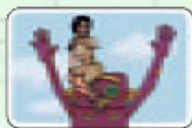
Squaw (10 cartes)