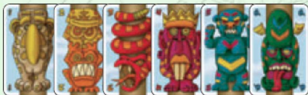
Cartes Totem de valeur 1 – 6 (en 10 cartes)