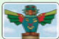
Tête (15 cartes)