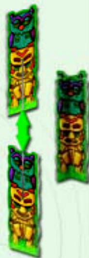
1 Totem Premier Joueur : À assembler avant la première partie