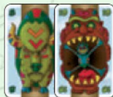
Cartes Totem de valeur 8 et 10 (en 5 cartes)